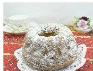
黒糖とジンジャーのクグロフ

黒糖とジンジャーのクグロフケーキ、スパイスクッキー、ジンジャークッキーが選ばれました。